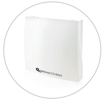
Q gateway 5.5 direct ist batteriebetrieben oder für die Stromversorgung verfügbar

Das Q gateway 5.5 direct wird ab Werk mit einer SIM-Karte ausgestattet und ausgeliefert – somit entfällt die aufwändige SIM-Karten-Verwaltung. Sämtliche Verwaltungs- und Datenerfassungsaufgaben des Gateways steuern wir über die QUNDIS Smart Metering Plattform .